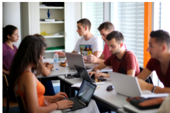
TRAVAIL EN GROUPE